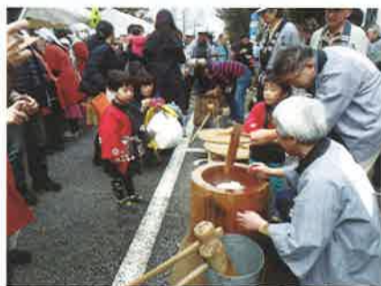
「子供餅つき大会」は子供が主役です