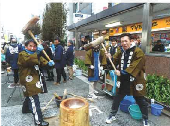
餅つき大会は、自然と笑みがこぼれます