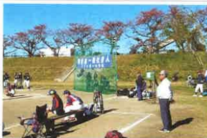
東京都一般社会人大会 昭島市くじら運動公園にて

キレ、コントロールとも群を抜いており、打者もありえない程のバットスピードと飛距離を誇り、一方で緻密なバント攻撃をかけてきたりしました。守備も全く隙がなく、完成度の高いチームでした。攻撃時には一球毎にサインを出し、守備の時も一球毎にチェックを入れ、チーム全体で勝つ事に徹した試合運びをしています。ソフトボールクラブで、これ程までに監督・コーチが選手たちに厳しい要求を徹底し、その要求に必死に応えようとする選手を今まで見たことがありませんでした。一昔前の高校野球のチームを思い出しました。一勝に対する執念が一番感じたチームだったと思います。全ての面において完敗でしたが、大変勉強になった試合でした。