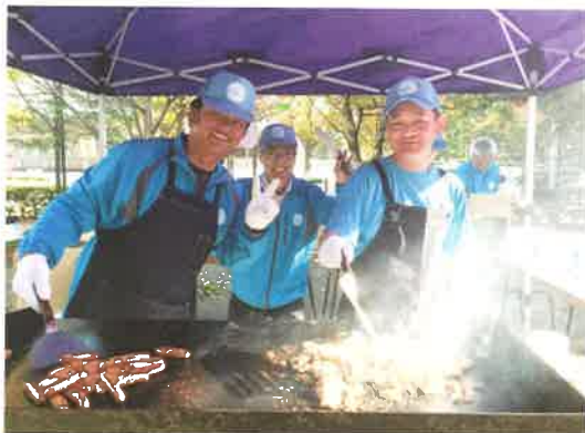
ただ今、男の料理中です！