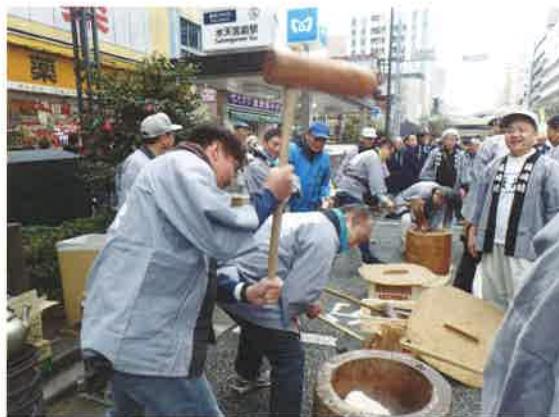
箱四町会は、臼2台で餅をつきます