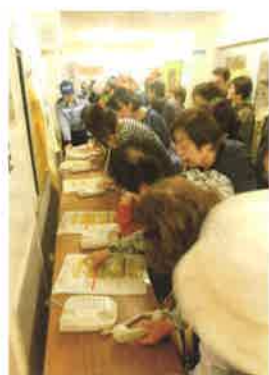
災害時伝言ダイヤル訓練の様子