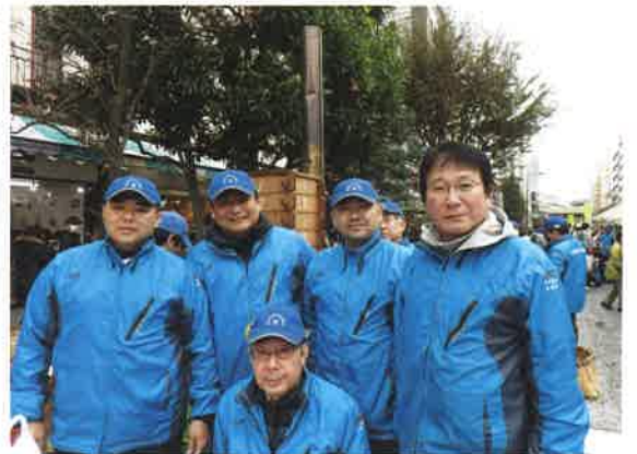
日本橋三の部地区委員の皆さん (箱崎町のメンバー)

前日の餅米の洗米作業から始まり、当日も巨大な蒸かし器を使って各町会へ蒸かした餅米を配布する作業を行いました。ご苦労様でした。