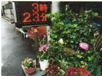
入口は綺麗な植木と電光掲示板が目印