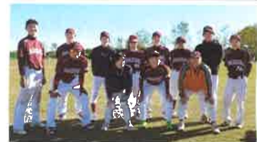
箱崎SCでは メンバーを 大募集中！