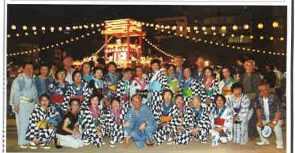
中央区大江戸まつり盆おどり大会 いっしょに盆踊りを踊りましょう！