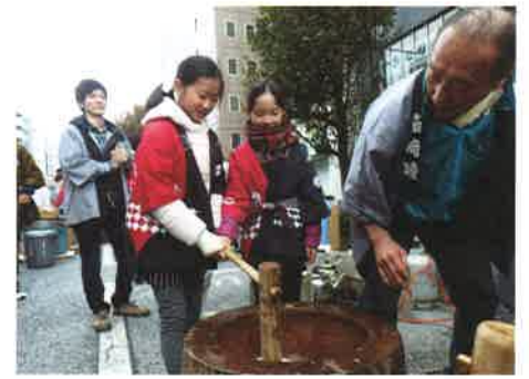
子供たちにも餅をついてもらいました