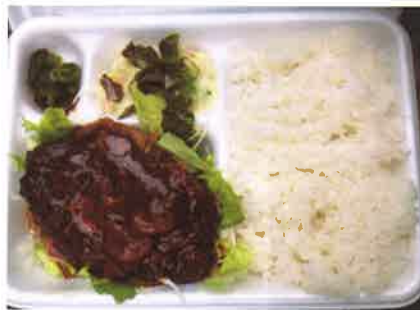
人気の手作りハンバーグ弁当