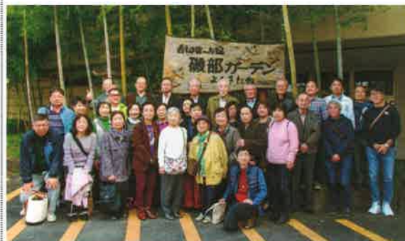
磯部ガーデンで記念撮影

最初の訪問地は、黄檗宗少林山・達磨寺。方位除けの守護神として知られています。境内の紅葉も見頃で、門を