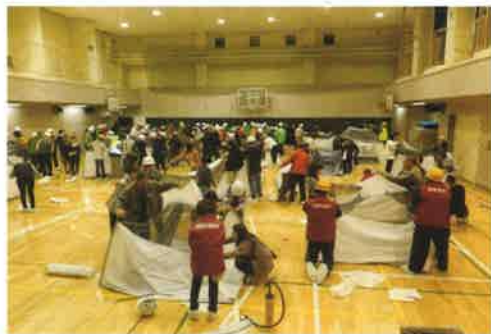
防災資機材取扱訓練の様子

組み立て後は体育館の照明を消し、バルーン投光器の明るさを体験しました。また、簡易トイレで使用する便袋の使用体験も実施しました。