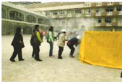
煙体験ハウスに入る参加者 煙で前は全く見えません 手探りで前へ進みます

また、防災マップアプリの普及啓発コーナーでは、タブレットを使用して実際の活用方法などについての説明をしました。