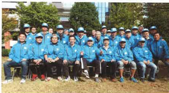
箱崎睦会への入会お問い合わせは、 各種イベント開催時などに遠慮無くどうぞ