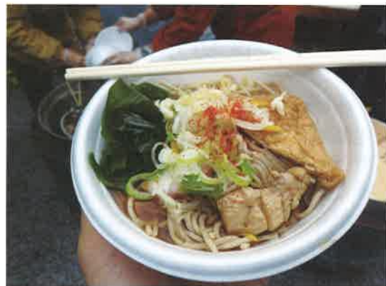
各町会ごとに提供される炊き出し

前日の餅米の洗米作業から始まり、当日も巨大な蒸かし器を使って各町会へ蒸かした餅米を配布する作業を行いました。ご苦労様でした。