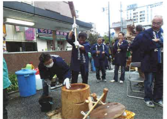
箱2・3町会も気合い入っています！