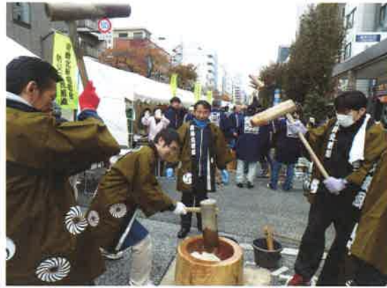
箱北町会は、3人の息を合わせて